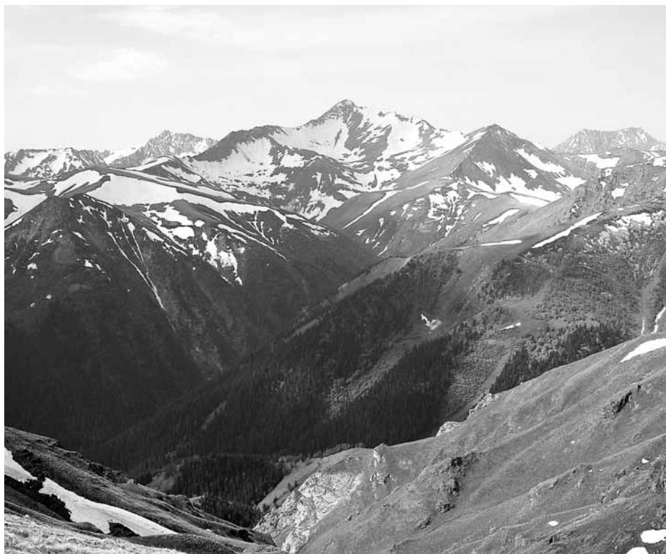
Типичный горный ландшафт Западного Кавказа.