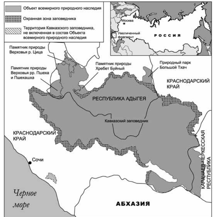
Объект всемирного наследия «Западный Кавказ». Карта подготовлена М. Дубининым.

На обнажениях горных пород разного возраста и состава можно наблюдать остатки вымерших организмов. Так, долина реки Белой приобрела всемир-