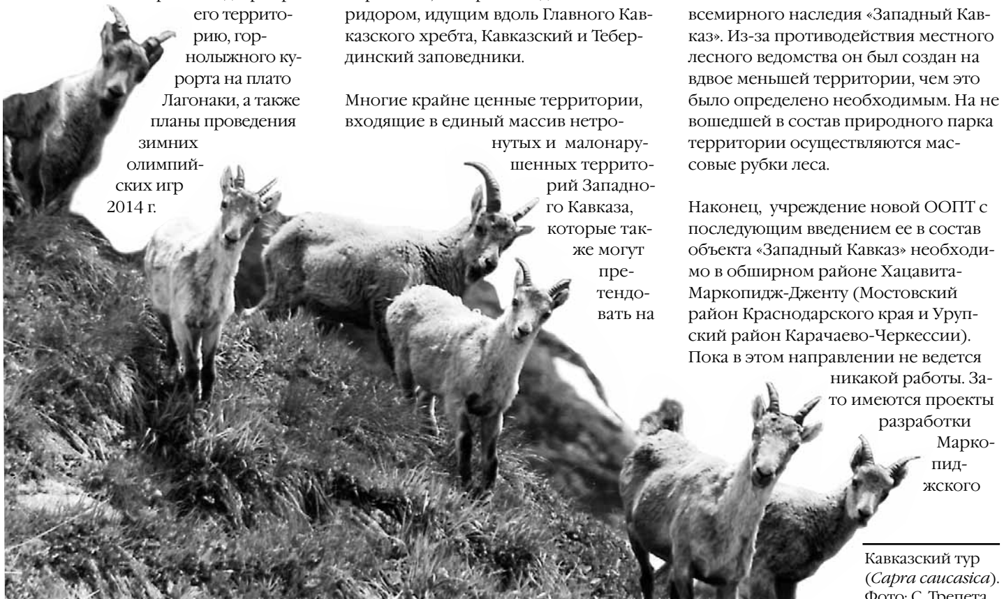
Кавказский тур ( Capra caucasica ).

Наконец, учреждение новой ООПТ с последующим введением ее в состав объекта «Западный Кавказ» необходимо в обширном районе Хацавита-Маркопидж-Дженту (Мостовский район Краснодарского края и Урупский район Карачаево-Черкессии). Пока в этом направлении не ведется никакой работы. Зато имеются проекты разработки Маркопиджского