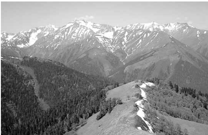
Огромное разнообразие горных ландшафтов Западного Кавказа определяет исключительное богатство флоры и фауны региона.

Флора и фауна Западного Кавказа чрезвычайно богаты. Только в высокогорной зоне произрастает 967 видов сосудистых растений, в других горных системах такого многообразия нет.